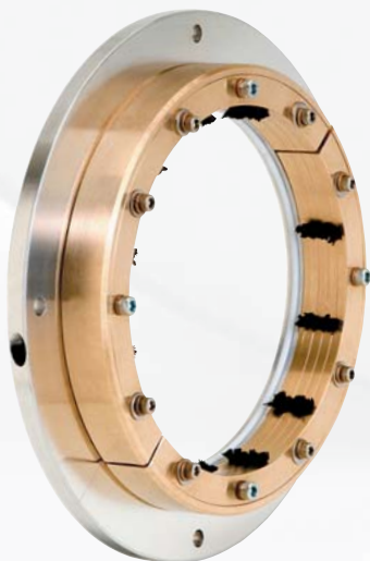
Inpro/Seal multi-stage CDR® pour systèmes à haute tension.